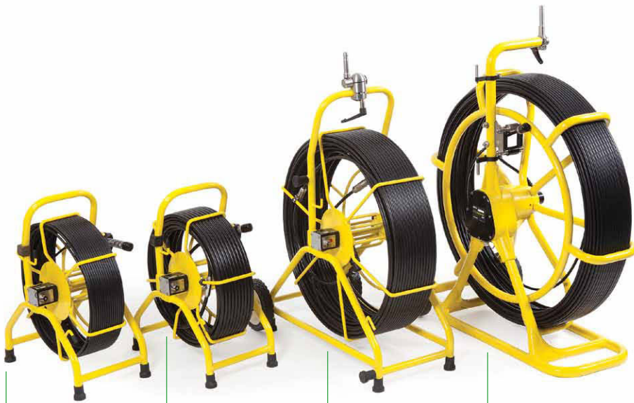
P341 Kabeltrommel für Installateure